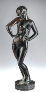
H. Hébert, 1927 MBAM

Maîtriser les proportions du corps humain fait intrinsèquement partie de l'apprentissage académique. Toutefois, en comparaison de la France où le nu abonde dans les Salons, au Québec comme au Canada, le nu connaît, entre le travail en atelier et l'exposition publique, un parcours sinueux, voire problématique. Il n'est pas d'emblée accepté! Cette conférence explorera les diverses manières dont les artistes d'ici ont abordé la question du nu en peinture mais aussi en sculpture où le nu est souvent investi d'une fonction allégorique ou symbolique. Enfin, on se penchera sur les approches plus modernes et plus audacieuses du corps dénudé.