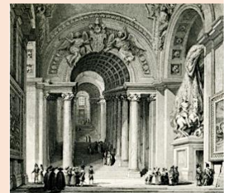
L'escalier cérémoniel du Vatican restauré par Bernini

De la Renaissance au Baroque, texte à télécharger ici (une page)